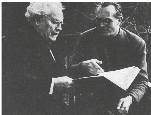
Ил. 2. X. Бидstrup (лауреат Премии) с М. Андерсеном-Нексе (член комитета)