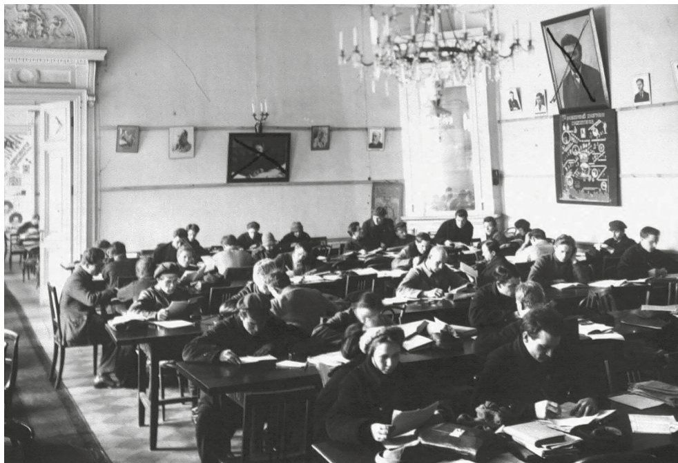
Студенты в аудитории Ленинградского коммунистического университета им. Г. Е. Зиновьева, 1925 г.