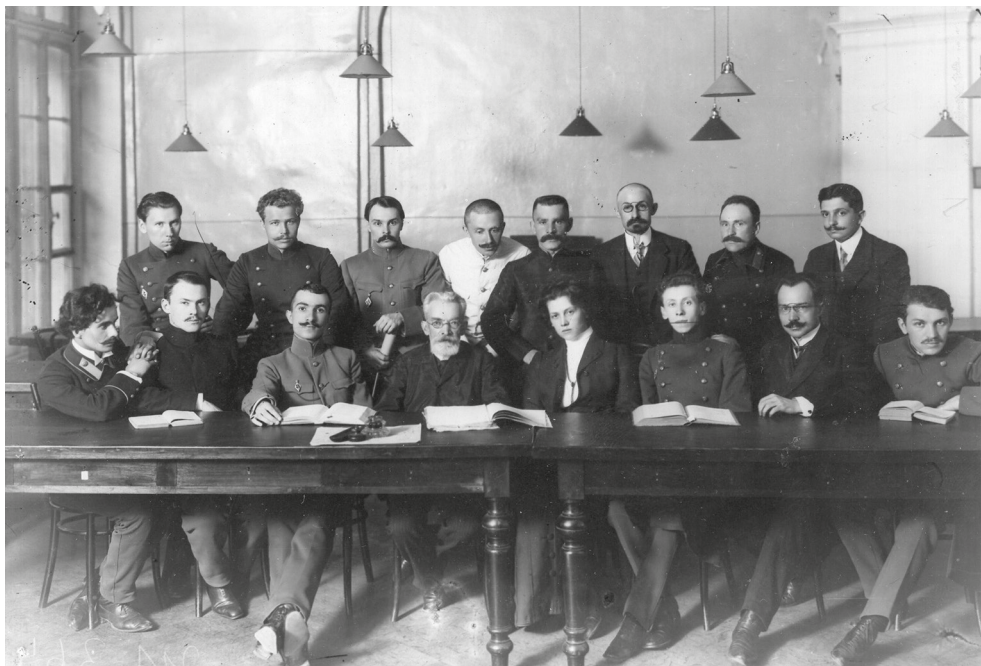
Группа преподавателей университета (сидит 4-й слева доктор юридических наук И. Я. Фойницкий), начало 1910-х годов