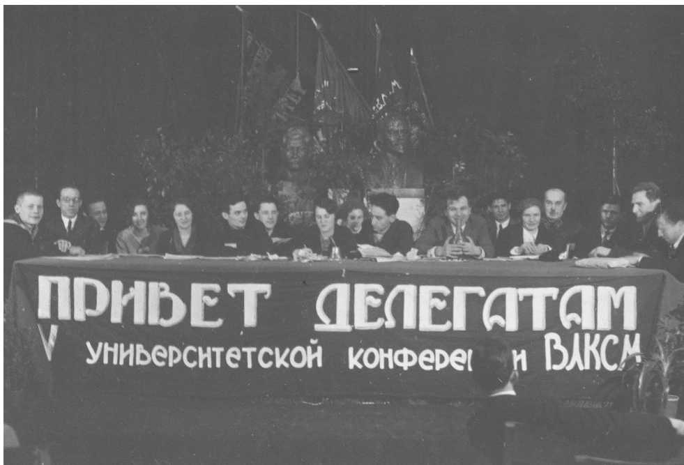
Вид президиума V конференции ВЛКСМ Ленинградского государственного университета, 1936 г.