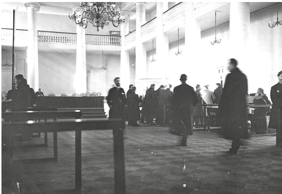
Выборы выборщиков в Первую Государственную думу в Петербургском государственном университете, 20 марта 1906 г.