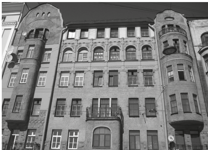
Шпалерная улица, 44а. «Жилой дом Думы». Построен в 1908 г. Архитектор С. Г. Гингер

В 1908–1912 гг. рядом с Таврическим дворцом, по адресу Шпалерная, 44а и 44б, появились два здания в популярном тогда стиле модерн. Оба здания называли «жилыми домами Думы», поскольку среди лиц, их населявших, оказалось немало членов и сотрудников аппарата нижней палаты российского парламента, например князь Николай Владимирович Голицын, в ведении которого находился думский архив 6 .