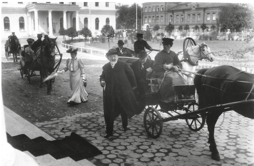
Приезд членов Государственной думы 1-го созыва на заседание в Таврический дворец 27 апреля 1906 г.

У него не было строго определенного назначения 3 . Дворец располагался на окраине, в Литейной части. Еще в петровские времена здесь находился пушечный Литейный двор, который и дал название всей зафонтанной приневской части города. В самом начале XX столетия Литейная часть Петербурга была чрезвычайно мало застроена и заселена. В обширном квартале между Захарьевской, Шпалерной и Потемкинской улицами тянулись казармы Кавалергардского полка. По соседству на Кирочной улице — казармы для солдат и офицеров Преображенского полка. Огромное пространство занимали унылые, без единого деревца, пустыри.