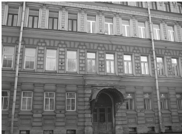
Шпалерная улица, 39. Здесь жил В. М. Пуришкевич

В 1908–1912 гг. рядом с Таврическим дворцом, по адресу Шпалерная, 44а и 44б, появились два здания в популярном тогда стиле модерн. Оба здания называли «жилыми домами Думы», поскольку среди лиц, их населявших, оказалось немало членов и сотрудников аппарата нижней палаты российского парламента, например князь Николай Владимирович Голицын, в ведении которого находился думский архив 6 .