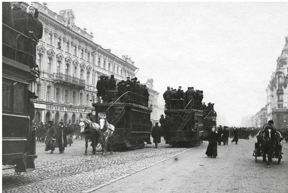
Конка на Невском проспекте. 1906 г.

нас обгоняют извозчики с депутатами. Избранники страны стягиваются к месту своего назначения. В конце Знаменской улицы нам пересадка на другую конку. Едем вправо, потом влево, потом все-таки вправо — к Таврическому саду и по Шпалерной. Сад большой, в нем много обнаженной зелени: снег стаял. Оранжереи. Соседи студенты острят: — Здесь выращиваются депутатские отношения к русской конституции. — Нет, здесь приучаются к растительной жизни... Пошли казармы, казармы, казармы. Масса военных, постовых. Разъезды. Наряды. А вот среди низменных желтых казарм и приземистый Таврический дворец... Ход для публики с Таврической улицы. Для министров и депутатов со Шпалерной — парадный» 14 .