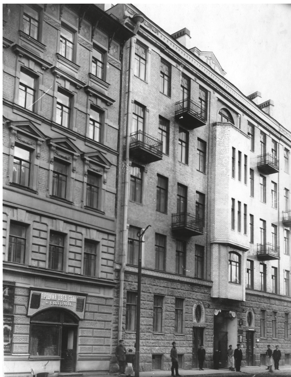
Кавалергардская улица, 3. Жилой дом «Общества собственников жилья». Построен в 1909–1910 гг. Архитектор И. И. Бургазлиев

на Сергиевской, у самой решетки Таврического сада, — вспоминала Зинаида Гиппиус. — С моего балкона виден был и соседний Таврический дворец, где помещалась Государственная дума» 9 .