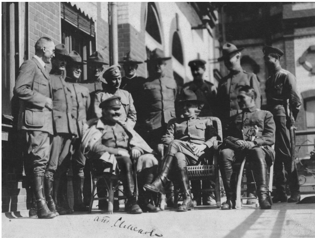
Атаман Г. М. Семенов с представителями американской миссии. 1918 г.

места в первом классе. Он начал вышибать солдат из вагонов 1-го класса. Сопrotивлявшихся порол нагайками, и через несколько минут в поезде был восстановлен порядок.