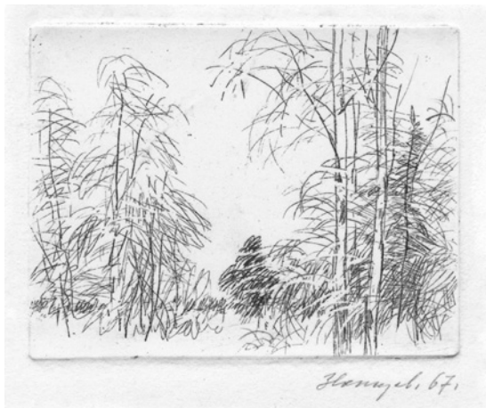
В. М. Звонцов. «Зимой». Офорт, 1967 г.

Одним из первых уникальных изданий, увидевших свет непосредственно по инициативе Василия Михайловича, был альбом «Офорты Рембрандта». Его не встретишь сегодня в букинистических магазинах — с ним не расстанутся. И, может быть, я ошибаюсь, но альбом этот по сей день остается единственным изданием офортов великого голландца в России в XX столетии.