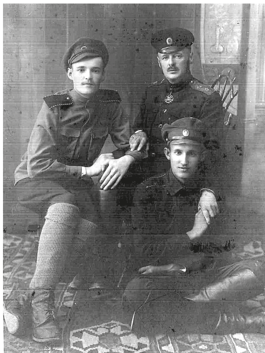
Фото 1. В. М. Пуришкевич с сыновьями Вадимом и Всеволодом, 1919 г. (публикуется впервые)

Поправивший во время Гражданской войны и избавившийся от обуявшего его в 1917 г. революционного угара, В. М. Пуришкевич вновь стал убежденным сторонником православной самодержавной монархии. «Только как Монархия и Монархия Самодержавная может и будет существовать единая, неделимая, [неразборчивое слово] Православная Россия», — такие слова были начертаны на стилизованном под свиток листе, который держал в руке на одной из запечатлевших его в 1919 г. фотографий лидер ВНГП. Но при этом остается открытым вопрос, кого именно лидер правых хотел видеть на российском престоле. В июле 1919 г. Пуришкевич в разговоре с поэтом М. А. Волошиным на его вопрос, неужели же он, как истинный монархист, настаивает на возвращении к власти династии Романовых, неожиданно ответил: «Нет, только не эта скверная немецкая династия, которая уже давно потеряла всякие права на престол <...> В России сохранилось достаточно потомков Рюрика, которые сохранили моральную чистоту рода гораздо более, чем Романовы. Хотя бы Шереметевы!» 8 Тут, впрочем, Пуришкевич заблуждался — к Рюриковичам графский род Шереметевых отношения не имел, но интересно другое. Учитывая то обстоятельство, что в руководящий орган ВНГП был введен один из представителей этой известной фамилии, невольно рождается