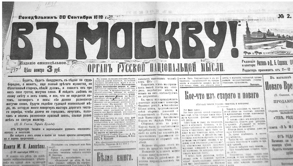
Фото 4. Газета «В Москву!»