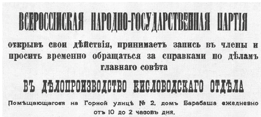
Фото 2. Объявление ВНГП (публикуется впервые)

в области Войска Донского 36 . В начале октября Пуришкевич вернулся в Ялту, где и оставался на протяжении следующего месяца. Помимо агитационного турне Пуришкевича ВНГП активно распространяла свой устав, который к августу был «отпечатан в громадном количестве экземпляров», и стремилась вербовать новых членов в армии 37 . По-видимому, определенные успехи в этом направлении имелись — так, более трети из числа присутствовавших на собрании группы ВНГП в Царицыне были военными (полковник, ротмистр, штабс-капитан, два поручика, прапорщик) 38 .